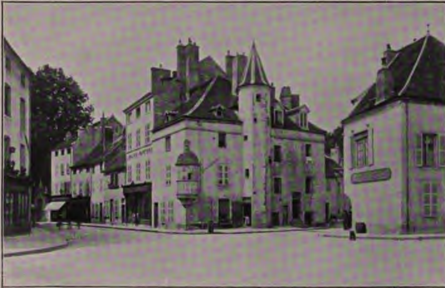
. Cliché Neurdein.

peuplées de saints et de saintes auxquelles l'église Notre-Dame a joint les siennes pour la circonstance, Aubussons avec leurs personnages géants dressés sur fond bleu et jaune et leurs étonnantes verdure. Le pavé disparaît sous le vermillon des tapis ; sur les degrés du puits sont disposés des géraniums et des roses, et, devant ce décor circulent les sœurs avec leurs hennin, leur tablier à bavette, et la longue traîne de leur robe blanche retenue à la taille, vêtues comme au XV e siècle.